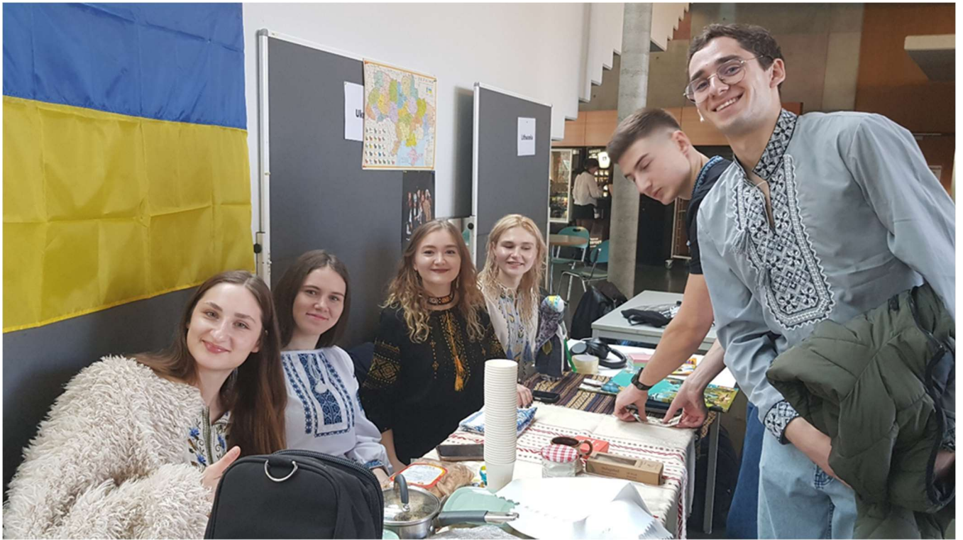
Im Foyer des Uni Gebäudes stellen sich Studenten aus aller Welt vor, darunter auch Studenten aus der Ukraine